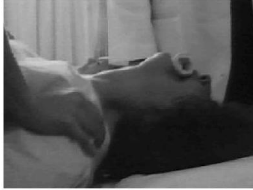
An Angle At My Table

“Zoo specimen”: Bunlar, akıl hastaları ile alay eden, onları küçük düşüren veya eğlence konusu yapan filmlerdir. Bedlam ve Marat/Sade bunlara birer örnektir.