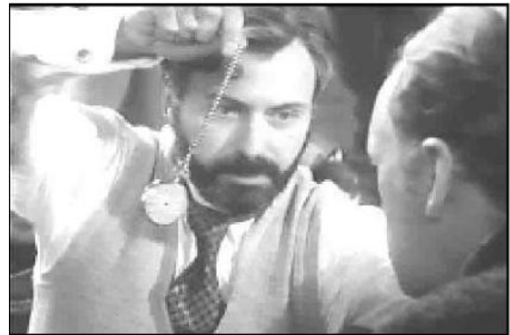
The Seven-Per-Cent Solution (1976)

Genelde bir meslek üstüne tartışma yapılırken, o meslekte yer alan kişinin kişisel özellikleri yerine mesleki başarısı konuşulur. Oysa, sözkonusu olan psikiyatri olunda, psikiyatristlerin kişisel özellikleri de gündeme gelmektedir. Çünkü onlar, bireylerin kişisel özellikleri ilgilendikleri için, kendi kişisel özellikleri de tartışmaya açılmaktadır.