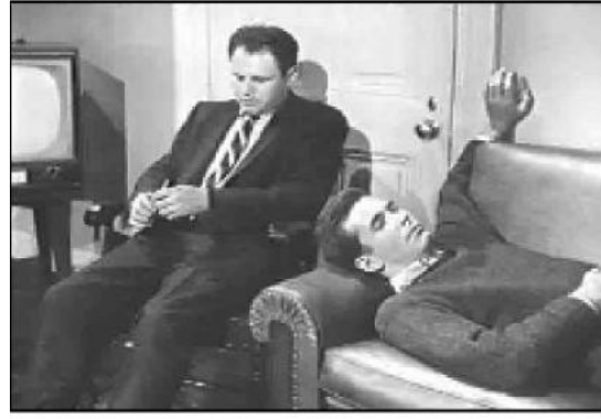
Fear Strikes Out (1957)

Psikiyatristler bir uçta iyi doktor, mükemmel bir insan, dost, yardımcı, insanları seven, iyi kalpli adam rolünü yüklenmişlerdir. Uzlaştırıcı, şefkatli, sevecen kişilerdir. Varlıkları iyileşmeyi sağlamak için yeterli olmaktadır. Schneider'in harika doktor tanımlaması burada yer almaktadır. Örnek olarak Caretakers , Ordinary People , Fear Strikes Out filminde yer alan psikiyatristler verilebilir.