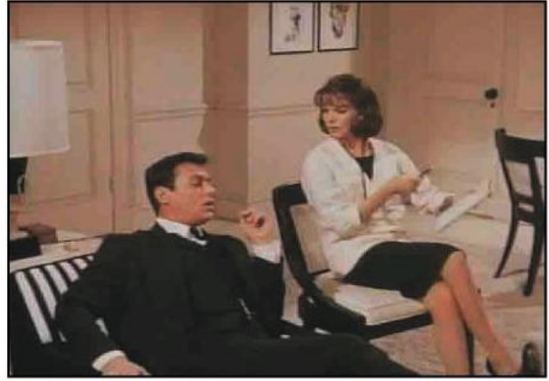
Sex and The Single Girl (1964)

Ruh sağlığı gizemini ve önemini çağlar boyu korumuştur. Son dönemde bireyselleşmenin ve toplumsal yüklerin ön plana çıkışıyla psikiyatride önemli bir çıkış yapmıştır. İnsanların kendilerinden ve yaşamlarından olan memnuniyet ve tatmin duygularının sorgulanması, ruh sağlığıyla ilgilenen bilimlere öne çıkarmıştır. Bu noktada insanların konuya ilişkin merakı had safhaya ulaşmıştır. Psikiyatristler ya da insan ruh sağlığıyla ilgilenenler ise bu konuda en bilgili kişilerdir. Onların işi insanları anlamak, tanımak ve çözmektir. Hele insanların bu konudaki merakı göz önüne alınırsa, ya da kendilerini ve başkalarını çözmek için yaptıkları amatör girişimlerin başarısızlıkla sonuçlandığı düşünülecek olursa psikiyatristlere bakış açısını anlayabilmek kolaylaşacaktır. Öte yandan psikiyatristlerin, insanların yapmayı isteyip yapamadıkları bu anlama ve çözme işini çok kolayca yapabildiklerine ilişkin bir inanç da yaygındır.